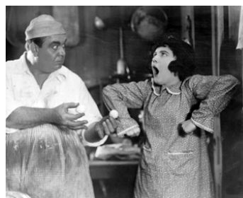
1918 BATTLING JANE d'Elmer Clifton avec Bertram Grassby