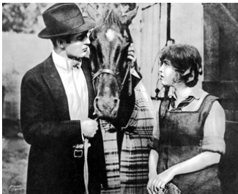
1916 ATTA BOY'S LAST RACE de George Siegmann avec Keith Amour