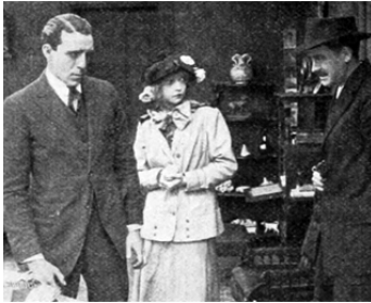
1914 THE REBELLION OF KITTY BELLE de Ch. Cabanne avec R. Harron, Raoul Walsch