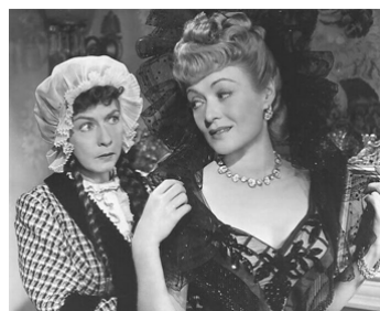
1946 QUADRILLE D'AMOUR (Centennial Summer) d'Otto Preminger avec Constance Bennett