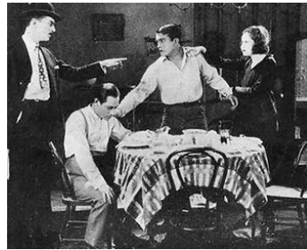
1925 THE BEAUTIFUL CITY de Kenneth S. Webb avec William Powell, Richard Barthelmess