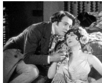
1923 LE CHÂTE AUX FLEURS DE SANG (The Bright Shawl) de J. Robertson avec Richard Barthelmess