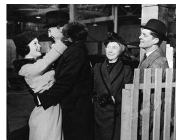
1963 LE CARDINAL (The Cardinal) d'O. Preminger avec Bill Hayes, Carol Lynley, Tom Tryon