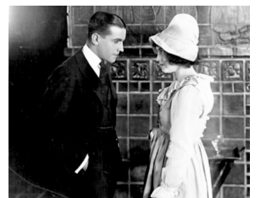
1918 LE MARIAGE SECRET (The Hope Chest) d'Elmer Clifton avec Richard Barthelmess