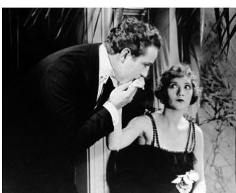
1919 L'AMOUR EN BOTTINES (Boots) d'Elmer Clifton avec Richard Barthelmess