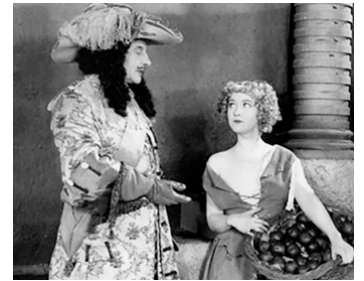
1926 NELL GWYNNE (Nell Gwynn) d'Herbert Wilcox avec Randle Ayrton