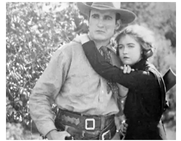
1914 THE MOUNTAIN RAT de James Kirkwood avec Donald Crisp