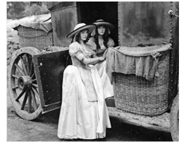
1921 LES DEUX ORPHELINES (Orphans of the Storm) de David W. Griffith avec Lillian Gish