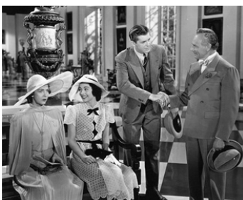
1944 OUR HEARTS WERE YOUNG AND GAY de L. Allen avec Gail Russell, Ch. Ruggles