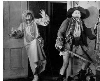
1925 LE CORSAIRE AUX JAMBES MOLLES de M. Tourneur avec Tully Marshall