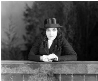
1920 PETITE DEMOISELLE REBELLE (Little Miss Rebellion) de George Fawcett