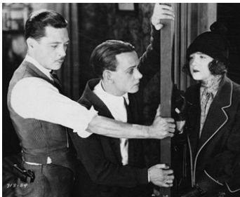
1925 LE DÉMON DE MINUIT (Night life of New York) d'Allan Dwan avec Rod La Rocque