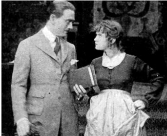
1916 LA CHIMÈRE DE SUZANNE (Little Meena's Romance) de Paul Powell avec Owen Moore