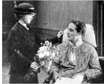
1915 VICTORINE (Victorine) de Paul Powell avec Ralph Lewis