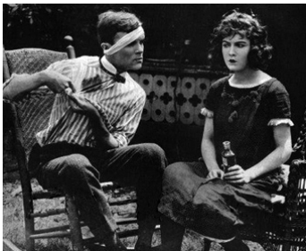
1922 THE COUNTRY FLAPPER de F. Richard Jones avec Glenn Hunter