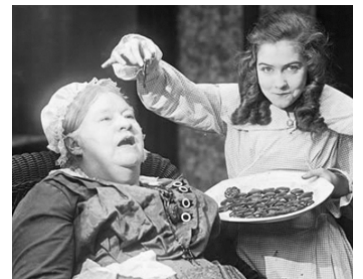
1917 HER OFFICIAL FATHERS d'Elmer Clifton & J. Henabery avec Jenny Lee