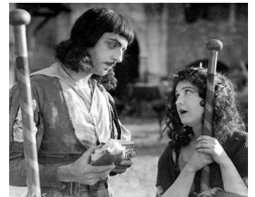
1924 ROMOLA (Romola) d'Henry King avec William Powell