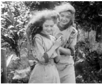
1912 L'ENNEMI INVISIBLE (The unseen Enemy) de David W. Griffith avec Lillian Gish