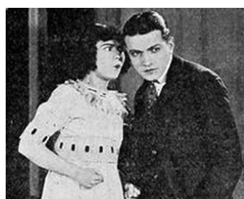
1919 I'LL GET HIM YET d'Elmer Clifton avec Richard Barthelmess