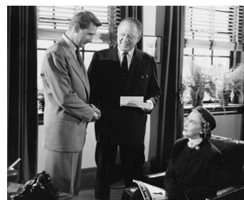
1951 QUAND LA FOULE GRONDE (The Whistle at Eaton) de R. Siodmak avec Lloyd Bridges