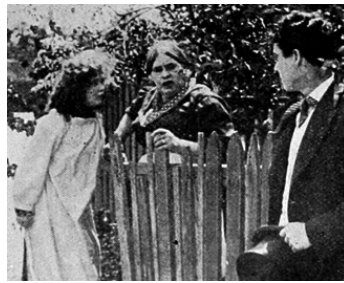
1913 HER MOTHER'S OATH de David W. Griffith avec Jennie Lee, John Harron