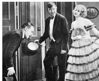
1927 SUR LA POINTE DES PIEDS (Tip Toes) d'H. Wilcox avec Miles Manders, Will Rogers