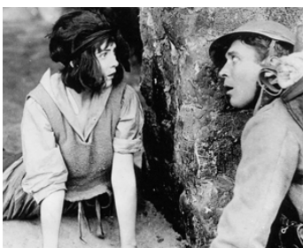
1918 LES CŒURS DU MONDE (Hearts of the World) de David W. Griffith avec N. Coward