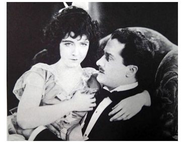
1920 REMODELING HER HUSBAND de Lillian Gish avec James Rennie