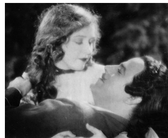
1927 MADAME POMPADOUR d'Herbert Wilcox avec Antonio Moreno