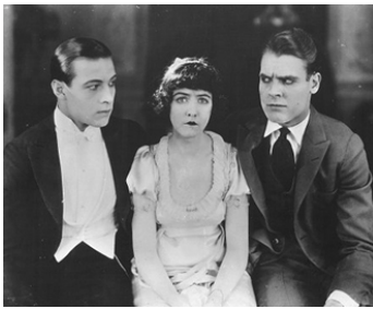
1919 NOBODY HOME d'Elmer Clifton avec Rudolph Valentino, Ralph Graves