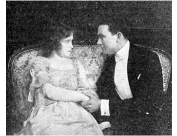
1915 BETTY OF GREYSTONE d'Allan Dwan avec Owen Moore