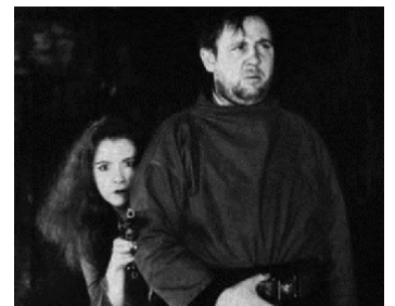
1930 LES LOUPS (Wolves) d'Albert de Courville avec Charles Laughton