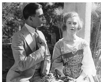
1918 BAS LES MASQUES ! (The Hun Within) de Chester Witney avec Douglas MacLean