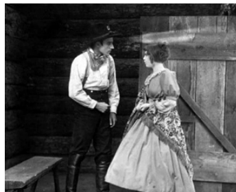
1917 THE LITTLE YANK de George Sherman avec Frank Bennett