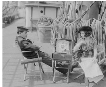
1923 FURIE (Fury) d'Henry King avec Richard Barthelmess